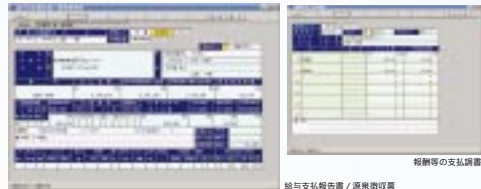
給与支払報告書 / 源泉徴収票

年末調整では、各種控除を自動計算。源泉徴収簿や源泉徴収票を自動的に作成します。また、法定調書では、提出に必要な各種帳票を自動作成。法定調書会計表はKSKシステム試行用のOCR用紙に直接印刷できますので、提出もスムーズ。年末調整処理や法定調書の作成業務を大幅に省力化できます。また、一度入力したデータは、翌年度更新処理により繰り越されますので、毎年変わらぬ項目のデータを有効に活用することができます。